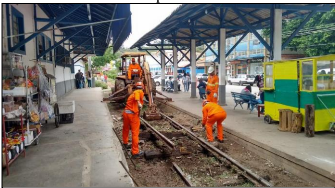
Operários na remoção dos velhos trilhos da L.A.

Para tentar resolver o problema 4,4km de trilhos, entre M. Pereira e Conrado, estão sendo retirados para receber novos no espaçamento de 1,60m. Com isso, o trenzinho que a AFPP operava há anos nesse trecho - que evitou o desmonte da linha - ficará ao Deus dará. Lamentamos não ter recebido nenhum apoio da Prefeitura nesses anos.