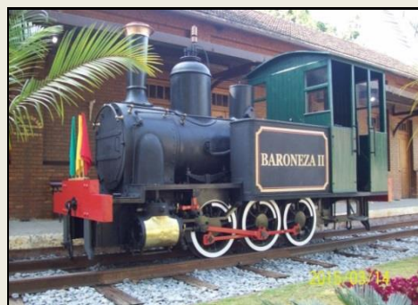
Loco 0-6-0T, agora com os para-choques, na bonita Estação de Nogueira.