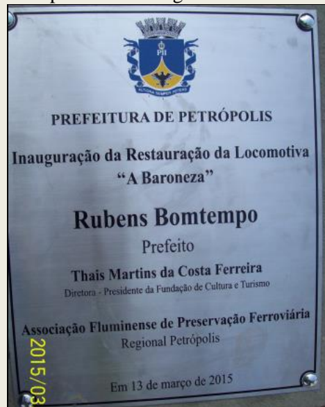
Acima, a placa comemorativa do evento.