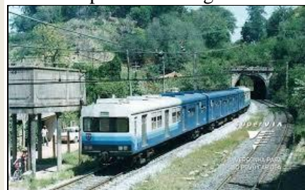
Foto do Barrinha quando em operação

A operação parou em 18/09/1996, após um terrível acidente com quinze mortos, a dois dias do leilão de “privatização” dessa malha, que foi assumida pela MRS-Logística.