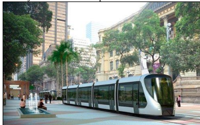
VLT passando em frente à Biblioteca Nacional.

O Rio de Janeiro será presenteado, em breve, com novos veículos sobre trilhos. O leito do VLT Carioca, no Centro já está recebendo os primeiros trilhos.