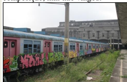
O Barrinha todo pichado, em B. de Mauá

Em 2006 o Gov. do Estado do Rio apostava na volta desse trem e gastou R$ 1,6 milhão na reforma de uma composição, mas não vingou.